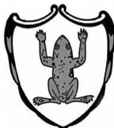
Герб Чесменского дворца

Лягушка с древних времен присутствовала в мифах многих народов мира: у китайцев лягушка — символ бессмертия, богатства и долголетия, в Египте она обозначает обновление жизни и воскресение, в греко-римской традиции — это эмблема богини любви Афродиты (Венеры), в Японии считается, что талисман в виде лягушки поможет сохранить верность в любви. В славянской мифологии лягушка ассоциируется с плодородием, влагой, дождем. Она — хранительница