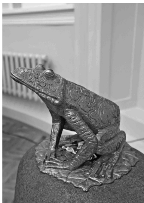
Хранительница Чесменского дворца

У многих знатных европейских родов есть геральдические животные-символы. Символом французского короля Хлодвига Меровинга (481 — 511), основателя Франкского королевства и родоначальника королевской династии Меровингов, была обыкновенная жаба.