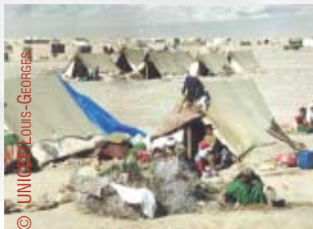
Лагерь для перемещенных лиц в Афганистане

Кризисная ситуация — обстоятельство, требующие немедленных действий. Они могут быть вызваны естественными или созданными человеком бедствиями, эпидемиями, а также конфликтами и войнами. Продолжительность периода необходимого для приведения в порядок и восстановления, после ударов стихии, зависят от конкретной ситуации. Это может длиться годами. Это обычно менее сложно в случае, когда имеешь дело со стихийных бедствий, чем с последствиями конфликтов или войн. Последние требуют, в качестве предпосылки для восстановления, прекратить военные действия, достичь перемирия, добываясь консенсуса по проблемам, связанных с будущим и обеспечивая длительный мир. В после кризисной ситуации не существует никакого точного представления или соглашения по вопросу, — когда закончится период восстановления, когда будет создана нормальная ситуация и начнется движение вперед. Это — длительный процесс.