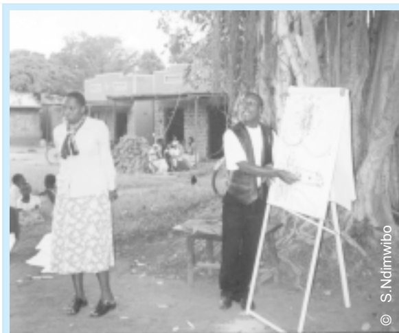
Образовательный митинг посвященный ВИЧ/СПИД, организованный ассоциацией Молодежь Уганды против СПИДа ( yuyaas@infocom.co.ug )