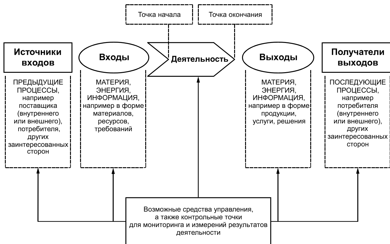
Рисунок 1 — Схематичное изображение элементов процесса

На рисунке 1 приведено схематичное изображение любого процесса и проиллюстрирована взаимосвязь элементов процесса. Контрольные точки мониторинга и измерения, необходимые для управления, являются специфическими для каждого процесса и будут варьироваться в зависимости от соответствующих рисков.