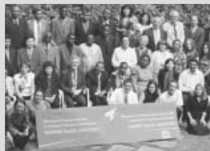
Групповая фотография ППК 2002/2003