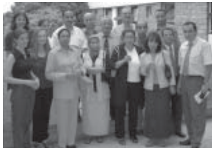
Группа из Марокко в МИПО

По инициативе Отдела Сотрудничества и Действий в сфере Культуры (ОСДК) [ Service de cooperation et d'action culturelle (SCAC)] французского Посольства в Рабате, Марокко, МИПО провел семинар по разработке программ образования для высших должностных лиц Управления Неформального Образования (УНО) [ direction de l'education non formelle (DENF)] и Управления по борьбе с неграмотностью [ Direction de la lutte contre l'analphabétisme (DLCA)] Министерства Образования, Марокко. Семинар проводился в офисе МИПО в Париже, с 10 по 13 Июня 2003.